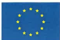
TABELA nr 7

Wartości punktowe odpowiadające wynikowi % z testu kompetencji